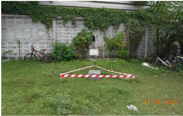
รูปที่ 2-9 การติดตามตรวจสอบระดับเสียง