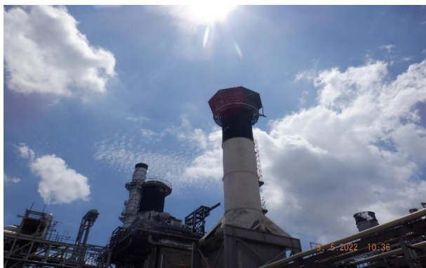
รูปที่ 2-1 ปล่องระบายอากาศสูง 30 เมตร