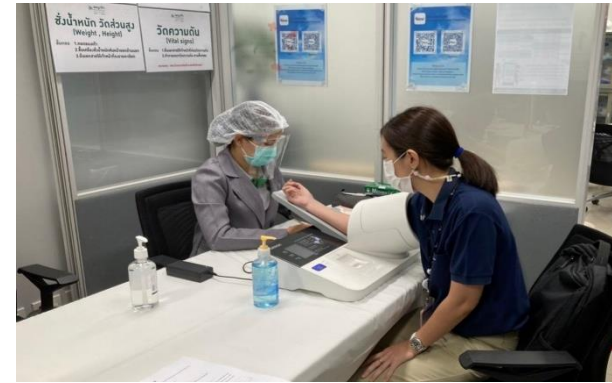
รูปที่ 2-10 การตรวจสอบสภาพพนักงาน