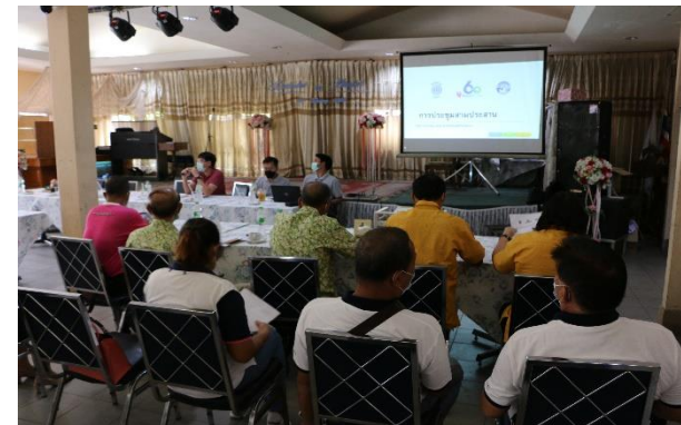
รูปที่ 2-7 การประชาสัมพันธ์ข้อมูลโครงการ