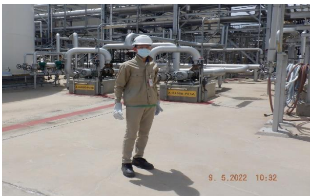
รูปที่ 2-13 อุปกรณ์ด้านความปลอดภัย