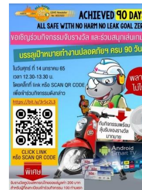
รูปที่ 2-14 กิจกรรมสัปดาห์ความปลอดภัย