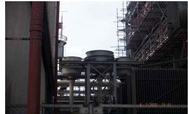
รูปที่ 2-8 โครงการติดตั้ง Silencers จำนวน 5 แห่ง