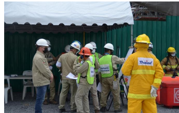
รูปที่ 2-12 การฝึกซ้อมแผนฉุกเฉิน