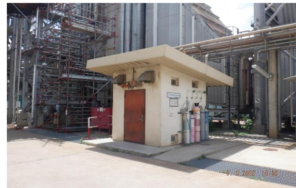
รูปที่ 2-2 ระบบตรวจสอบคุณภาพอากาศแบบต่อเนื่อง (CEMS)