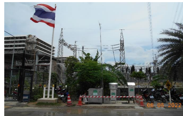
รูปที่ 2-4 การติดตามตรวจสอบคุณภาพอากาศในบรรยากาศ