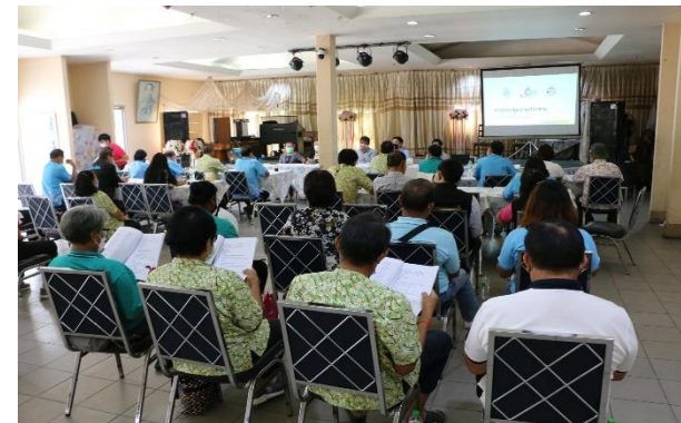
รูปที่ 2-6 โครงการสนับสนุนและพัฒนาชุมชนด้านต่าง ๆ