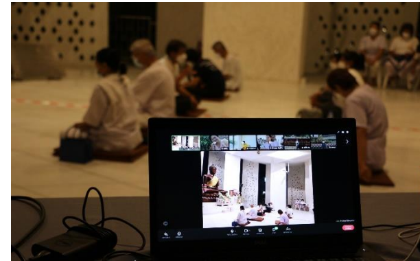
รูปที่ 2-6 (ต่อ) โครงการสนับสนุนและพัฒนาชุมชนด้านต่าง ๆ