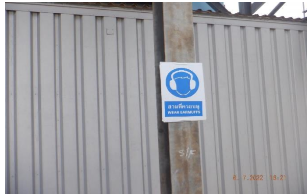
รูปที่ 2-11 ป้ายเตือนให้สวมปลั๊กอุดหู (Ear Plugs) หรือที่ครอบหู (Ear Muffs)