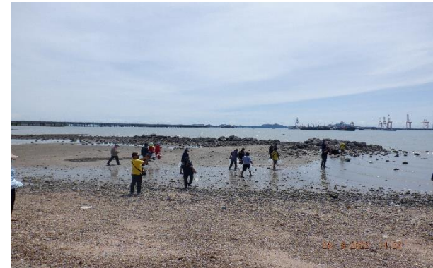
รูปที่ 2-5 ตัวอย่างโครงการที่ให้การสนับสนุนในการปรับปรุงสิ่งแวดล้อม